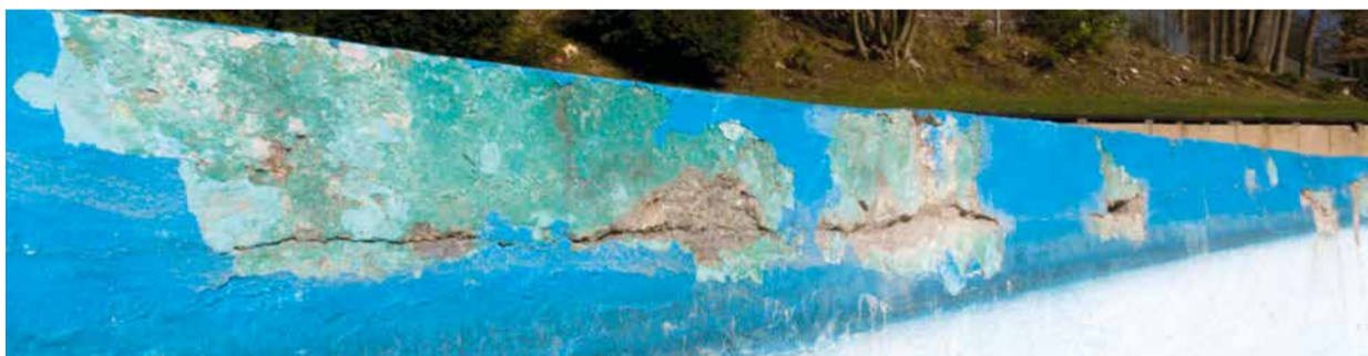
Herpine ungeschminkt. So sieht es aus, bevor im Frühjahr blaue Farbe darüber gestrichen wird.

1 Mio. €. Im Zuge dieser Sanierung konnten – aus Zeit- und Kostengründen – jedoch nur 20% der Gesamtbeckenwand erneuert werden. Die verbliebenen Wände erfahren seither alljährliche Ausbesserungsarbeiten kosmetischer Natur – die Risse werden mit blauer Farbe übermalt. Da das auf Dauer keine Lösung ist und der Zugang in das Becken endlich barrierefrei werden soll, hat die Stadt Fördermittel aus dem Landesprogramm »Soziale Integration im Quartier« beantragt. Sollte der Antrag auf 600.000€ bewilligt werden, würde zumindest ein Teil durch neue Fertigbetonwände ersetzt werden können.