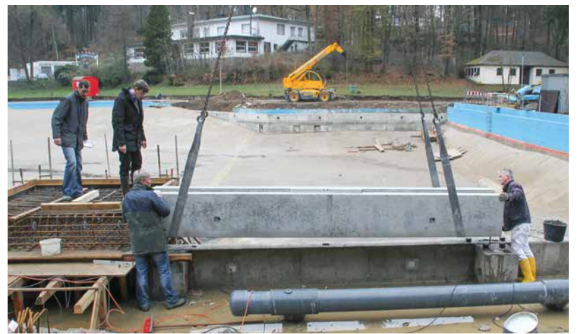
Beckenrandsanierung 2013/14 | 29.11.2013