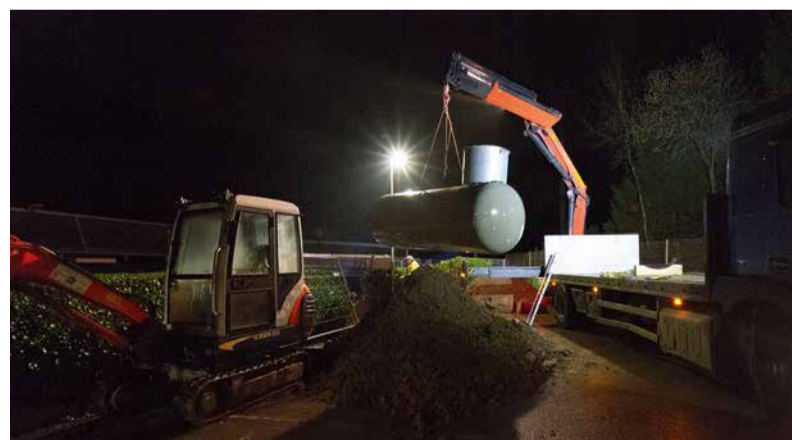
Kleine Nachtaktion: Anlieferung des neuen Gastanks am 11.12.2018

Die Herpine ist ein unbeheiztes Freibad. Doch das stimmt nicht ganz. Während der Wintermonate muss das Hauptgebäude mit den Sanitäreinrichtungen, der Schwimmbad-technik und den Küchengeräten im Kiosk frostfrei gehalten werden. Das übernahmen bisher stromfressende Nachtspeicheröfen. Diese wurden nun durch eine energieeffiziente Gasheizung ersetzt. Der neue Gastank wurde in den Rabatten zum Parkplatz versteckt. Im Winter speist er nun die Heizung, im Sommer liefert er das Gas für die neuen Hochleistungsfrühschüsseln im Kiosk.