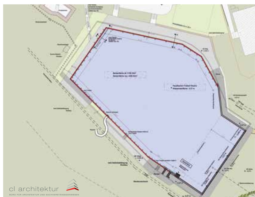
cl architektur BÜRO FÜR ARCHITEKTUR UND SACHVERSTÄNDIGEN

Planung und Durchführung des Projektes verantwortet der im Schwimmbadumbau erfahrene Halveraner Architekt Stefan Czarkowski von CL-Architektur.